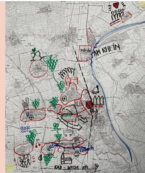
Stadtdörfer Worms 2021