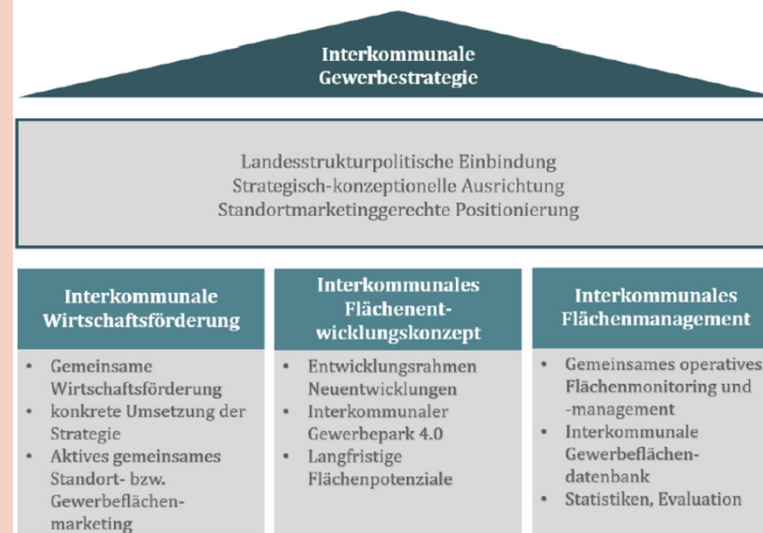
Abbildung 6: Struktur Interkommunale Gewerbe strategie

Zukunftsinitiative „Starke Kommunen – Starkes Land“ 2020